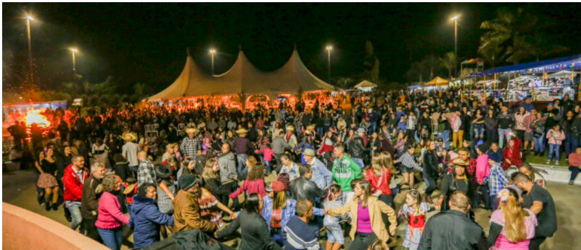
A linda Festa Junina reuniu a família metalúrgica no Clube de Campo.