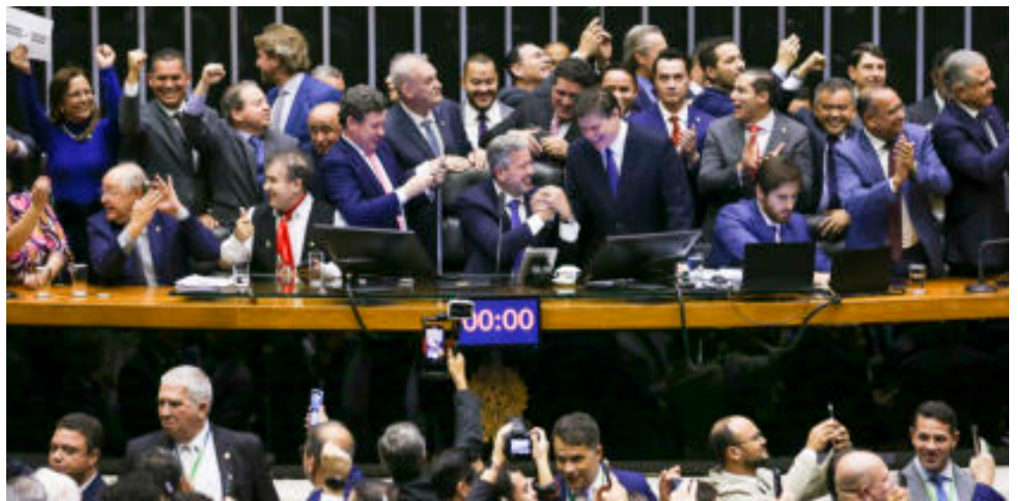
Aprovada na Câmara, reforma seguiu para o Senado.

O movimento sindical tem acompanhado as discussões da Reforma Tributária em Brasília, trabalhando para garantir que os benefícios da reforma cheguem ao trabalhador. É uma alteração importante da estrutura de arrecadação dos impostos e que, se bem aplicada, beneficiará a todos os brasileiros.