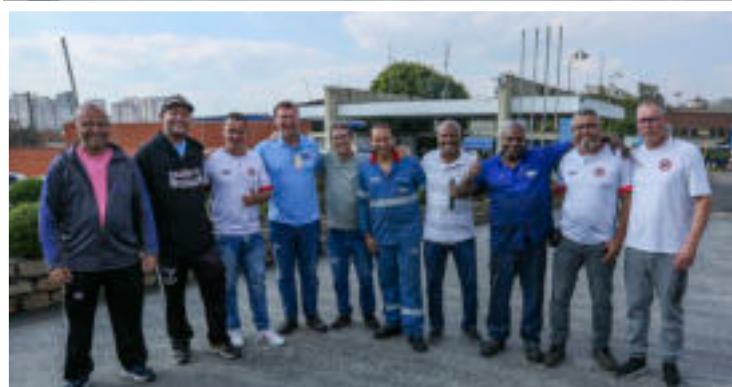
Assembleia na Dana aprova PPR. Ao lado, diretores do sindicato com integrantes da comissão de negociação do PPR.