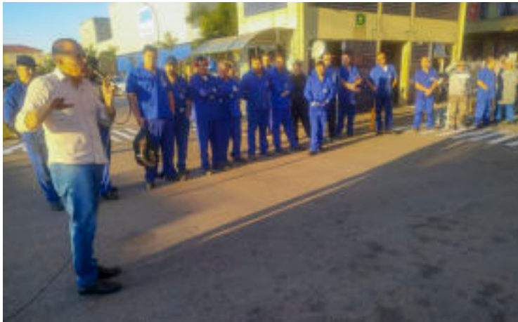
Companheiros aprovaram PLR na Weir

O PLR terá o mesmo valor para todos os funcionários e será pago em