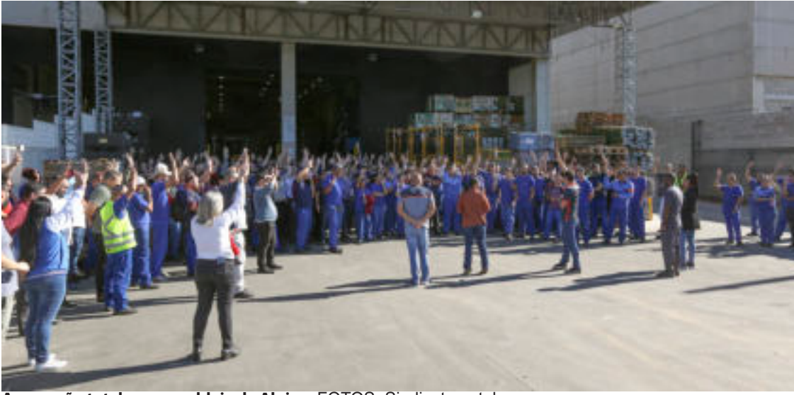
Aprovação total na assembleia da Alpino.