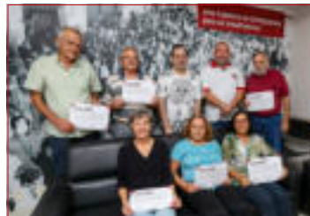
Turma de Informática

Aponte seu celular para o QR e confira as fotos e os vídeos da Festa Junina.