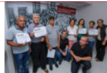
Formados de Smartphone