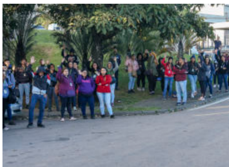
Assembleia aprovou a redução de jornada.

A redução foi negociada com a empresa e a proposta foi levada pelo Sindicato aos trabalhadores, que aprovaram a negociação. A redução de jornada será por três meses, com garantia de emprego de mais três.