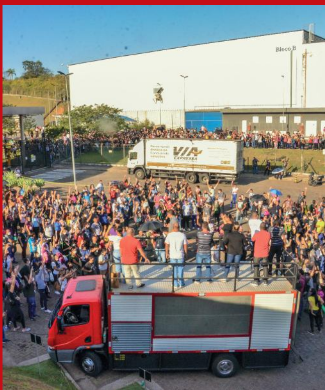
Na ocasião, também foram apresentadas as principais reivindicações dos trabalhadores. Os sindicalistas também deram ênfase na Campanha Salarial e no período de eleições.