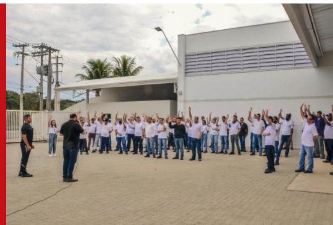
O formato de jornada possibilita compensação dos sábados durante a semana.

O texto aprovado prevê horário comercial e as horas extraordinárias e o descanso semanal remun-