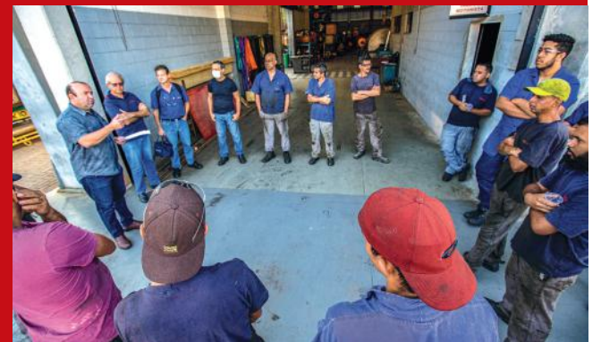
Tecnopele: O Sindicato prevê melhorias no PLR da Tecnopele no próximo período