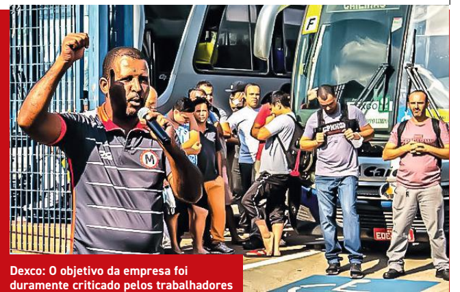
Dexco: O objetivo da empresa foi duramente criticado pelos trabalhadores

“O sábado livre é uma conquista em que conseguimos compensar com horas trabalhadas na semana. A empresa quer definir o sábado como dia útil, uma medida ruim aos trabalhadores e que gera custos para a empresa com alimentação, transporte, energia e refugio. Essa conta não fecha e quem teve essa infeliz ideia com certeza não passa cartão”, disse o diretor sindical,