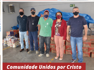
Comunidade Unidos por Cristo