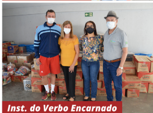
Inst. do Verbo Encarnado