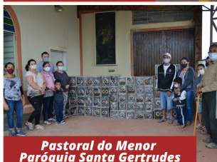
Pastoral do Menor Paróquia Santa Gertrudes