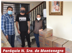
Paróquia N. Sra. do Montenegro