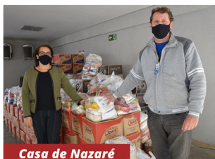
Casa de Nazaré