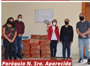
Paróquia N. Sra. Aparecida