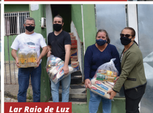
Lar Raio de Luz