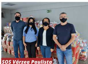
SOS Várzea Paulista

CLUBE DE CAMPO (de terça a sexta-feira, das 8h às 18h) - Rod. Tancredo Neves, km - 53/54 - Bairro Castanho - Jundiaí - SP.