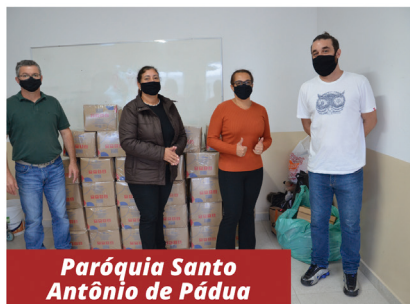
Paróquia Santo Antônio de Pádua