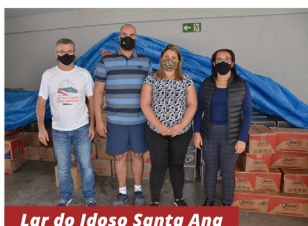
Lar do Idoso Santa Ana