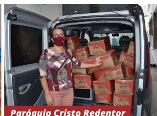
Paróquia Cristo Redentor