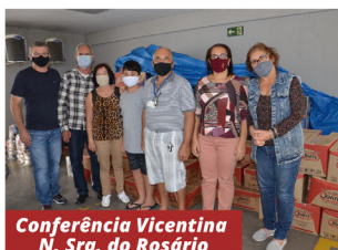
Conferência Vicentina N. Sra. do Rosário