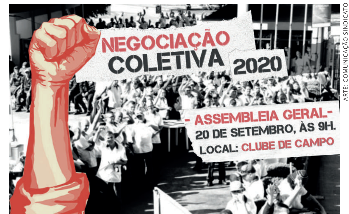
ARTE: COMUNICAÇÃO SINDICATO

Com o aprofundamento da reforma trabalhista, os trabalhadores estão amargando um período de profundas incertezas e ameaças aos direitos conquistados. A pandemia expôs ainda mais a ineficácia da gestão econômica e os impasses das esferas trabalhista e de saúde pública. Esse cenário impactou diretamente na classe trabalhadora com as reduções de jornadas e salários,