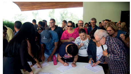
O abaixo assinado será encaminhado ao Congresso