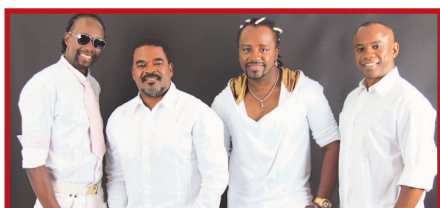
Negritude e Jr