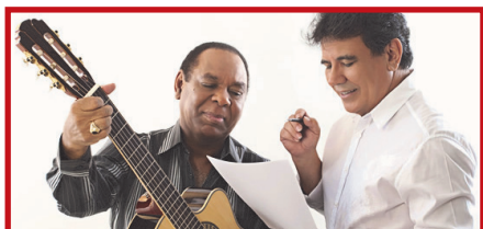
Mococa e Paraíso