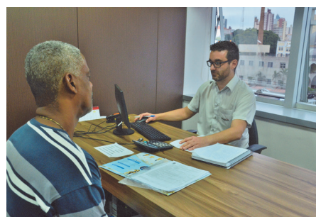
O Sindicato faz a sua declaração até o dia 30 de abril

Metalúrgicos e aposentados têm desconto na prestação desse serviço. Não deixe para a última hora! Quem