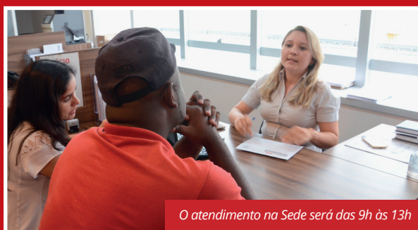
O atendimento na Sede será das 9h às 13h

Para quem não é sócio, essa é a oportunidade de fazer parte do Sindicato . Para se associar, os documentos são os seguintes: carteira profissional, último holerite, CPF/RG, comprovante de endereço, certidão de casamento e certidão de nascimento do(s) filho(s) (menores de 18 anos).