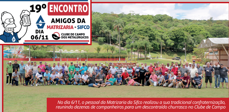
No dia 6/11, o pessoal da Matrizaria da Sifco realizou a sua tradicional confraternização, reunindo dezenas de companheiros para um descontraído churrasco no Clube de Campo