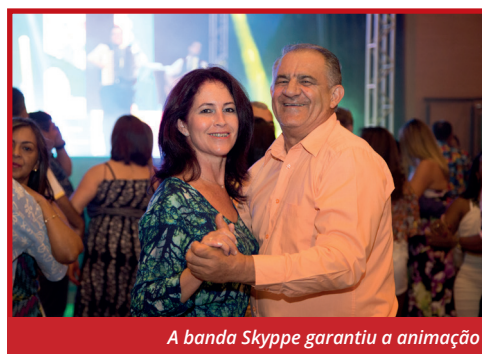
A banda Skyppe garantiu a animação