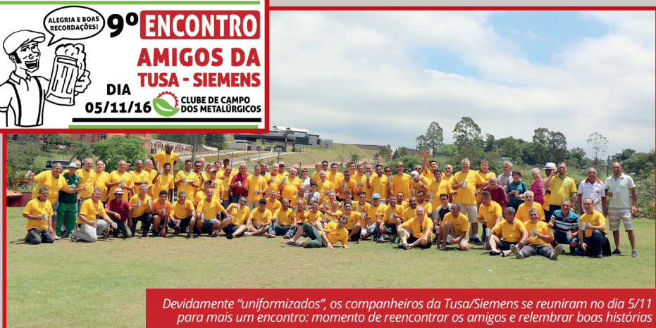
Devidamente "uniformizados", os companheiros da Tusa/Siemens se reuniram no dia 5/11 para mais um encontro: momento de reencontrar os amigos e relembrar boas histórias