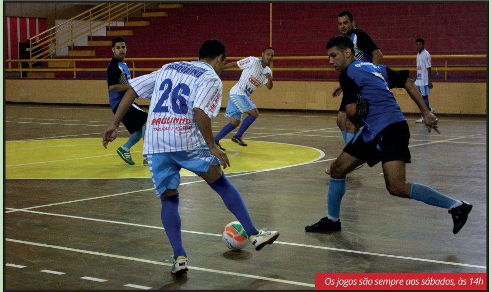
Os jogos são sempre aos sábados, às 14h