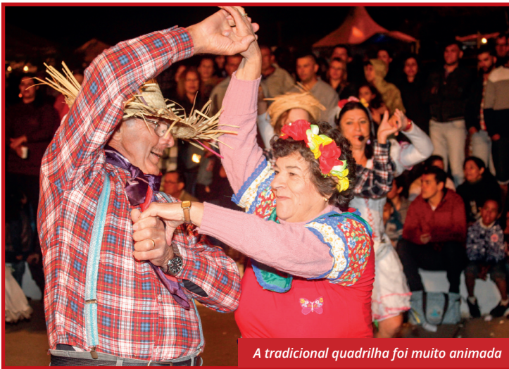
A tradicional quadrilha foi muito animada