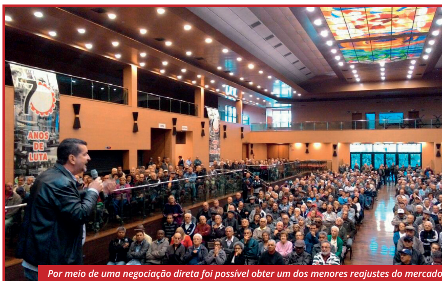
Por meio de uma negociação direta foi possível obter um dos menores reajustes do mercado

O médico Márcio Degáspare, da Sobam, explicou que o grupo vai aperfeiçoar o atendimento