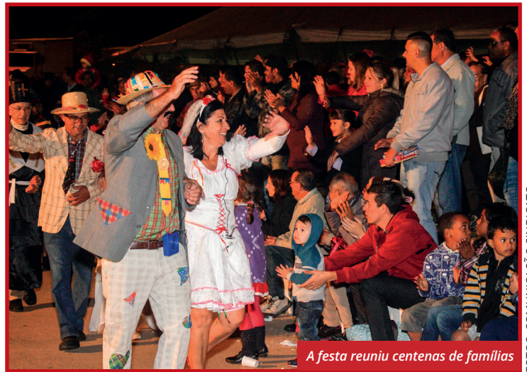
A festa reuniu centenas de famílias