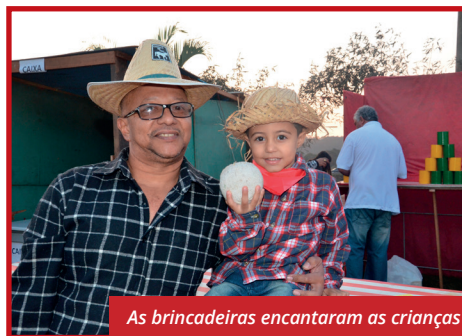
As brincadeiras encantaram as crianças