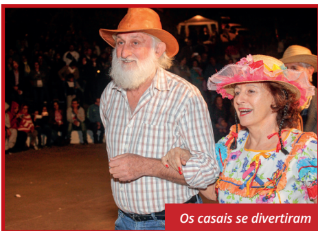
Os casais se divertiram

de fogos e a tradicional quadrilha. Aqui você confere alguns momentos e no site estão todas as fotos da festa junina mais animada da região!