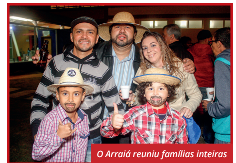
O Arraiá reuniu famílias inteiras