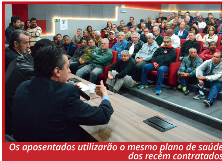
Os aposentados utilizarão o mesmo plano de saúde dos recém contratados

Após a Sifco transferir os inativos para a Associação Desportiva Classista (ADC) com o intuito de diminuir custos, os aposentados tiveram reajustes grandes. Por este motivo, o departamento jurídico do Sindicato entrou com uma ação coletiva e obteve bons resultados. Agora, os aposentados da Sifco poderão utilizar o plano de saúde na modalidade pós pagamento com rateio, ou seja, os valores serão variáveis pois a efetiva