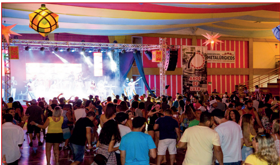
Edição 2016 do CarnaMetal reuniu aproximadamente 4 mil foliões nos quatro dias de evento.

A galeria de fotos do carnaval já está no nosso site: www.sindicatometal.org.br