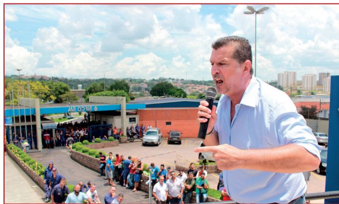
Apesar das dificuldades de 2015, Sindicato negociou com a Sifco para garantir o PLR