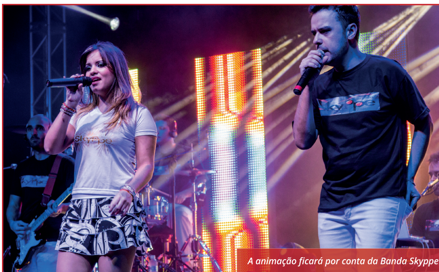
A animação ficará por conta da Banda Skyppe

Bebidas alcoólicas só serão vendidas aos maiores de 18 anos.