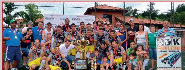
Com muita técnica, o time do ADC Sifco foi o campeão no módulo Interfábrica