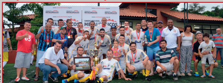
Mostrando muita raça nos jogos, o Tubarão comemorou o título no módulo Aberto.