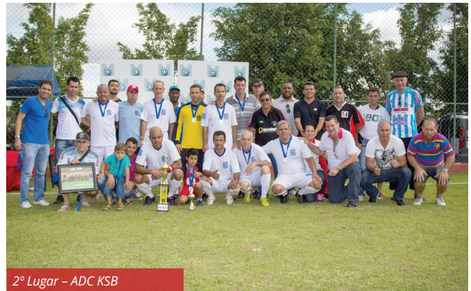
2º Lugar – ADC KSB