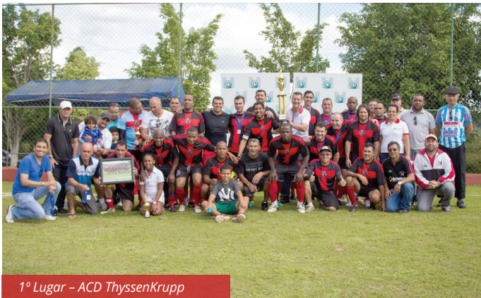
1º Lugar – ACD ThyssenKrupp