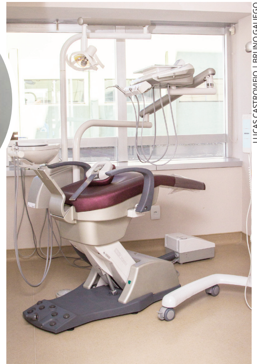
LUCAS CASTROVIEJO | BRUNO GALIEGO

junho. As consultas podem ser agendas pelo telefone 4527-3100. Os associados contarão com desconto no atendimento e os aposentados terão um preço ainda mais especial.