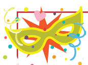
Matinê no Clube de Campo dos Sindicato dos Metalúrgicos, em 1989