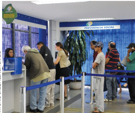
Aposentados e trabalhadores são penalizados por cortes de direitos

"Sabemos que há casos de pessoas mal intencionadas que se dedicam a cuidar de idosos no fim da vida