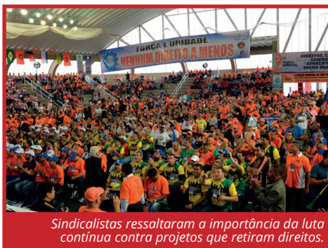
Sindicalistas ressaltaram a importância da luta contínua contra projetos que retiram direitos.

Reunindo três mil sindicalistas de todos os estados, o Congresso deu ênfase à continuidade da luta de resistência contra as