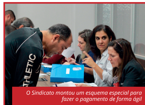
O Sindicato montou um esquema especial para fazer o pagamento de forma ágil

fui acompanhando o Sindicato e hoje conseguimos", revelou.