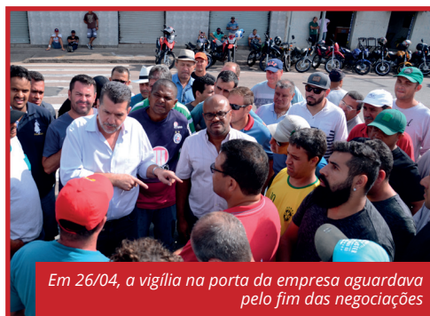
Em 26/04, a vigília na porta da empresa aguardava pelo fim das negociações